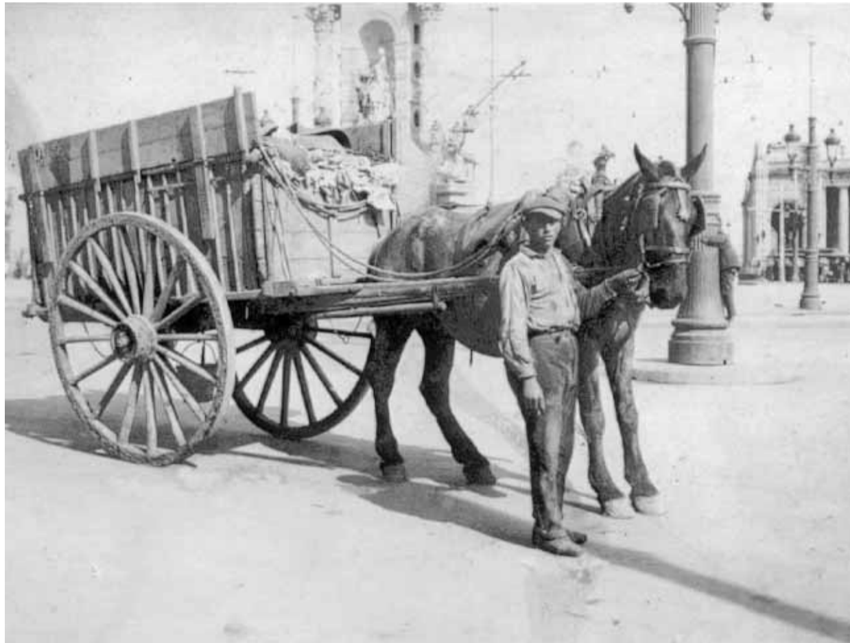
ARCHIVO CORP. CLD

Luego de repetidas crisis y de superar situaciones que parecían abocarla a la desaparición, su tenacidad y capacidad de adaptación le permitió a mediados del decenio de los sesenta acordar finalmente un contrato con el Ayuntamiento para responsabilizarse de la recogida de basuras en la mitad de Barcelona. La cooperativa comenzó entonces una evolución y una serie de cambios que, pese a una competencia ambiciosa, culminó, llevada por la modernización expansiva, a ser rebautizada en el 2004 con el nombre de Grupo CLD.●